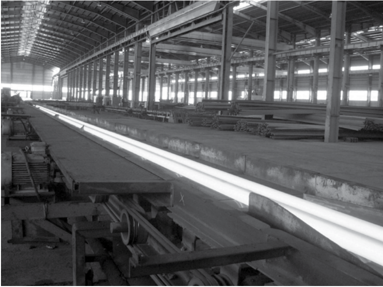
تولید تیر آهن

ترکیه، هند و برزیل را در یک طرف و چین، کره و مالزی را در طرف دیگر قرار می دهند. شاخص ها نشان می دهند محتوای توسعه این دو گروه، زمین تا آسمان با هم تفاوت دارد. کشورهای ترکیه، هند و برزیل، به غیر از کشور ما، بدهی مزمن خارجی دارند. کسری تراز بازرگانی شان به صورت مزمن افزایشی است. در حالی که گروه دوم این طور نیست. همه شاخص ها نشان می دهد برنامه توسعه این کشورها متفاوت است. گروه دوم مسیرها را شناخته اند تا مشکل حل شود، ولی گروه اول خیر؛ کشورهای منطقه ما هم در همین زمره قرار می گیرند. در شکل گیری این روند نیز ذی نفعان و تأثیر آن ها روی دولت ها خیلی مؤثر است.