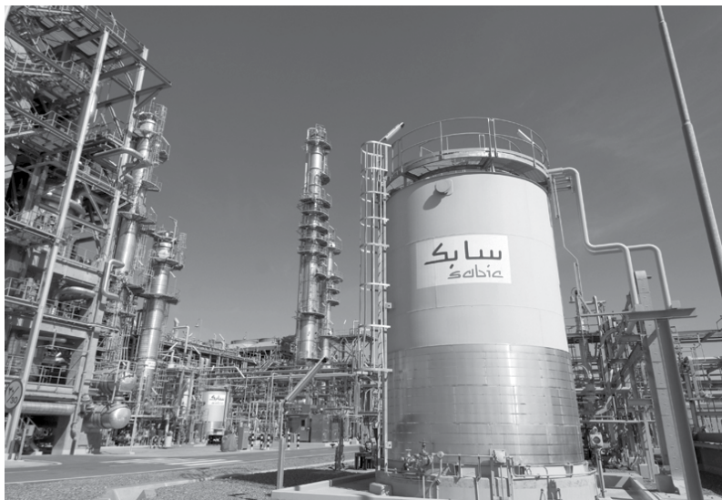
شرکت سایبک عربستان

دست نخورده و بلکه افزایش هم داشته است؛ اما ریسک‌ها را باید بخش‌های واقعی اقتصاد کشور تحمل کنند. این پنج بخش عبارت‌اند از: خام‌فروشان معدنی، پتروشیمی، بانک‌ها و داروسازی‌ها، زیرا تا حدی آن‌ها هم مونتاژکار یا مخلوط‌کننده مواد هستند و البته برخی از فولادها. در پتروشیمی ۱۰۰ واحد تولیدکننده وجود دارد. یک کشور در حد ایران چند واحد پتروشیمی نیاز دارد؟ عربستان فقط یک سایبک (Sabic) دارد و با همین یک شرکت هم در دنیای این بخش قدم علم کرده و رتبه دوم یا سوم دنیا را دارد.