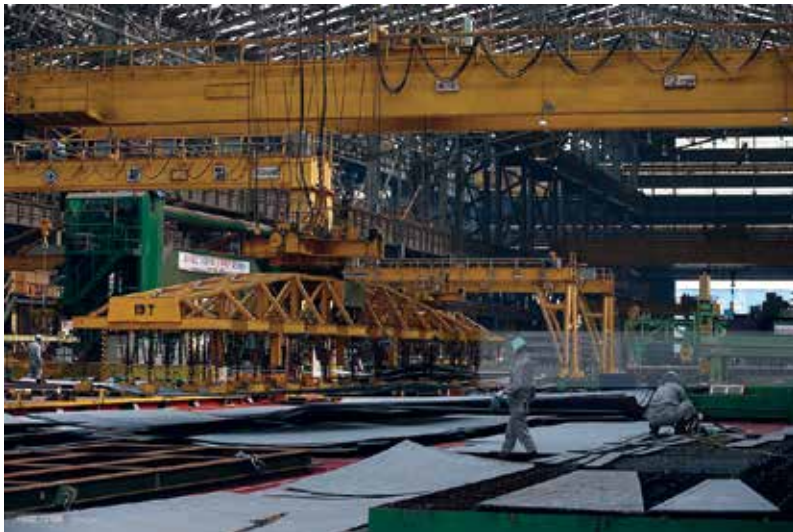
تولید ورق آهن در کره جنوبی

در آن شورای عالی یا نهاد یا هیئت فراقوه‌ای، دولت باید باشد، نهادهای نظارتی باشند، اما سه جزء دیگر هم باید حضور پیدا کنند؛ ۱. اساتید اقتصادی، فنی، علوم اجتماعی و حقوق به انتخاب خودشان نه انتصاب؛ ۲. مدیران اجرایی بخش خصوصی و بزرگان کارآفرینی به انتخاب خودشان؛ و ۳. نماینده‌های کارگران و کشاورزان به انتخاب خودشان. تعداد آن‌ها هم باید برابر باشد. هر تصمیمی که این نهاد اتخاذ کند، قانون اقتصادی خواهد بود.